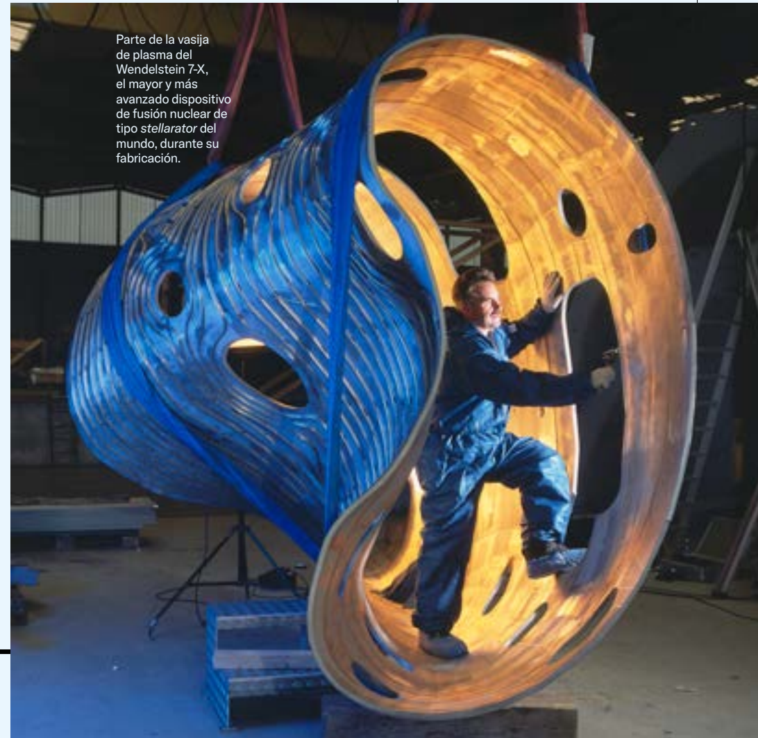
Parte de la vasija de plasma del Wendelstein 7-X, el mayor y más avanzado dispositivo de fusión nuclear de tipo stellarator del mundo, durante su fabricación.

el avance en paralelo hacia la primera Planta Piloto de Fusión europea. El objetivo es acelerar la transición científico-tecnológica y la plena comercialización, posicionando así a Europa como referente global en el sector. El auge de iniciativas privadas a escala internacional refleja un cambio de modelo de financiación: del exclusivamente público al público-privado. Ni el sector público, donde hoy se concentra el conocimiento científico y tecnológico de la fusión, ni el dinamismo del sector privado, actuando por separado, podrán acelerar por sí solos su desarrollo. De ahí la necesidad de un modelo mixto público-privado, ya en fase de diseño en Europa y que debe estar operativo en 2026, para mantener el liderazgo en esta energía disruptiva. Necesitamos reforzar la coordinación e integración de los pilares del Programa Europeo de Fusión —incluidos Fusion for Energy (F4E), EUROfusion, la industria y los Estados miembros—. De este modo, es posible garantizar la coherencia estratégica y la alineación de las actividades de fusión con las prioridades políticas, energéticas e industriales de la Unión Europea.