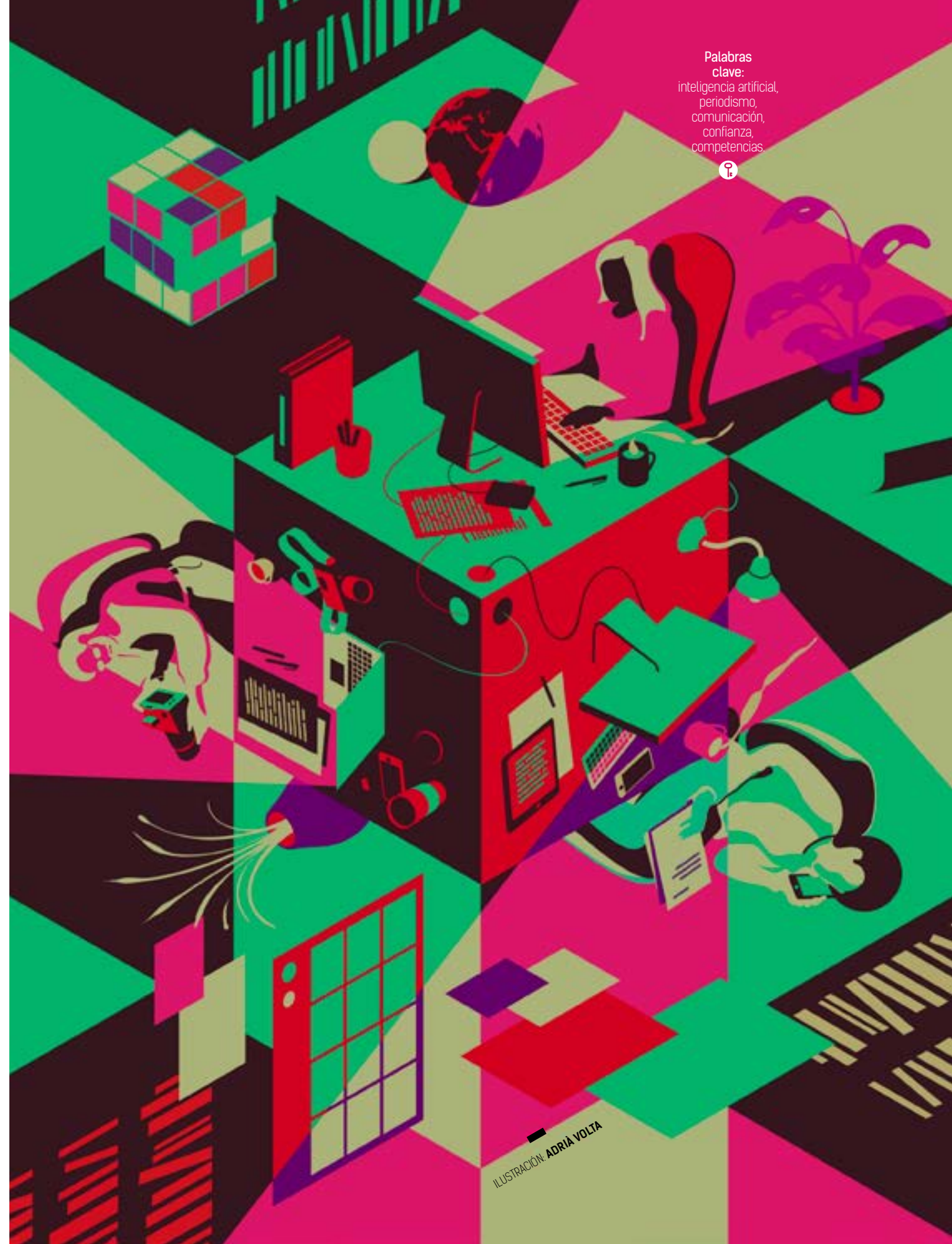
ILUSTRACIÓN: ADRIÀ VOLTA