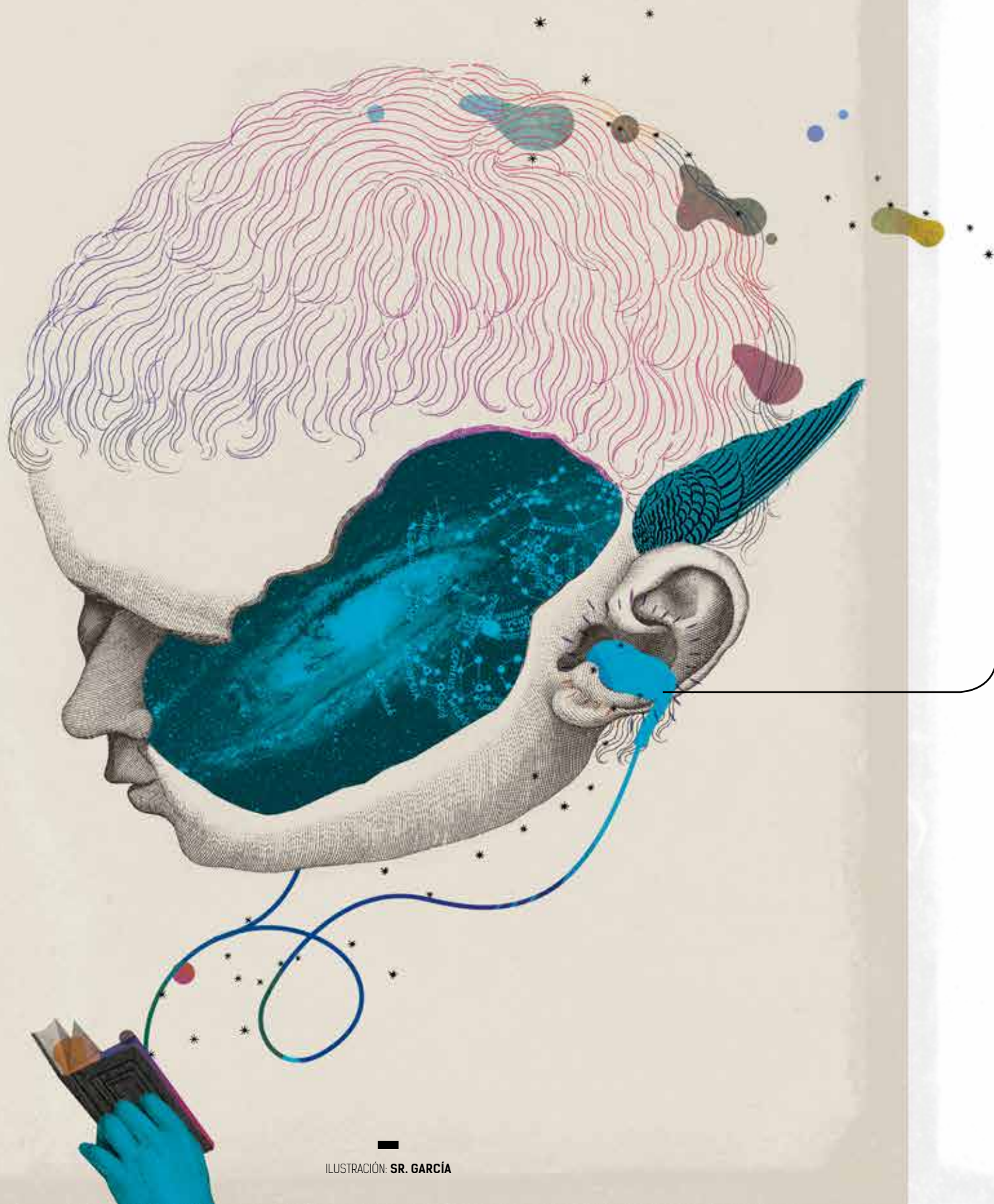
ILUSTRACIÓN: SR. GARCÍA

Palabras clave: audiolibro, industria editorial, lectura, libro, digital