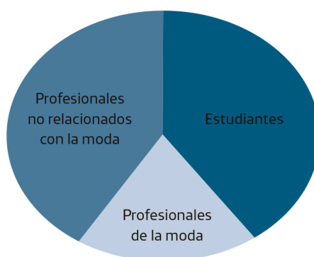
Figura 1. Autoría de los blogs de moda

Solo una de cada cinco blogueras de moda son profesionales relacionadas con el sector, aunque cuatro de cada diez ven su blog como una herramienta profesional, por eso se han convertido en grandes creadoras de contenido, principalmente fotografías y texto (ver figura 1).