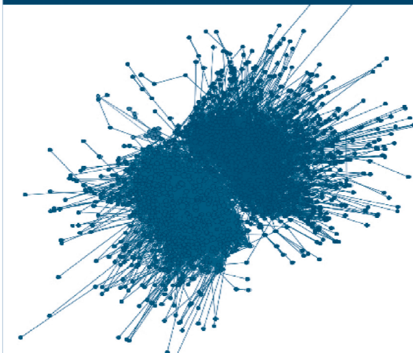
Figura 3. Polarización en la 'blogosfera' cubana (2013)

Un análisis de la agenda pública de los 'blogueros' desde enero de 2013 hasta marzo de 2014 refleja la coexistencia de temáticas vinculadas a la cultura e identidad nacional, el uso y acceso a Internet, el papel de los medios de comunicación estatales, la implementación de mecanismos para la contratación extranjera de profesionales del deporte, el nuevo código de trabajo cubano, el censo de población y vivienda, la liberalización de la compraventa de autos y casas y el proceso de unificación monetaria, entre otros.