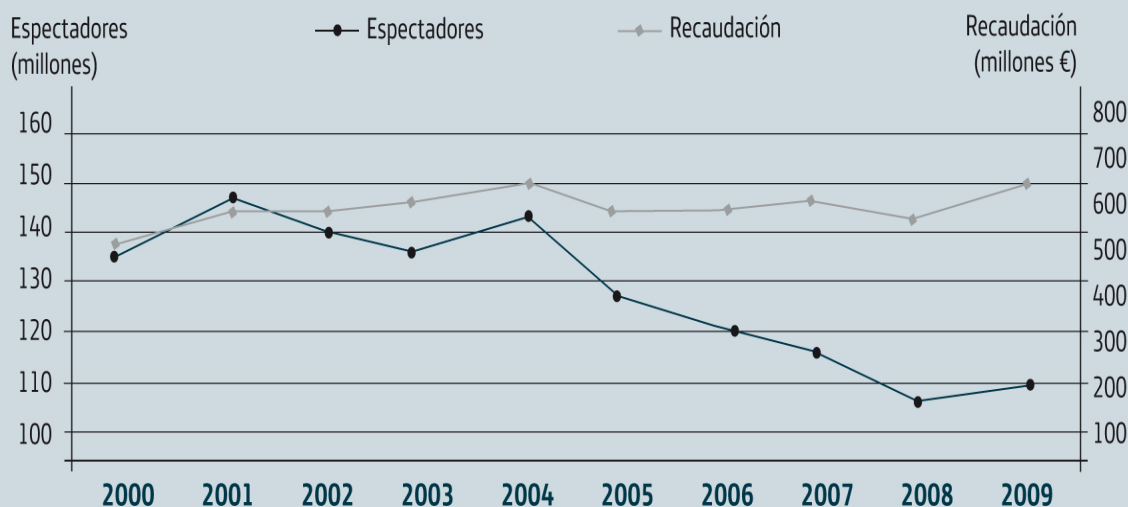
Gráfico 2. Evolución número de espectadores y recaudación en España, 2000-2009

FUENTE: MINISTERIO DE CULTURA, ICAA. BOLETÍN INFORMATIVO DE CINE Y AUDIOVISUALES, VARIOS AÑOS.