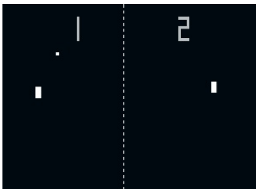
Figura 2. Fotografía de una obra de la exposición On & On.

La principal carencia de la exposición es su falta absoluta de herramientas de soporte extradiegéticas, ya que como se ha comentado carece de página web y de catálogo, aunque tal vez esto pueda explicarse como una manera más de lograr que toda la exposición sea absolutamente efímera.