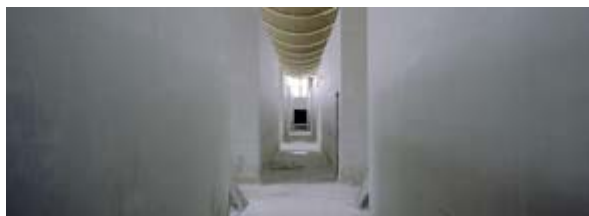
Pasillo blanco (2004) Fotografía digital sobre papel Fuji profesional Digital photography on Fuji professional paper 108,00 x 300,00 cm

El momento histórico actual nos induce a pensar que estamos atravesando un túnel [colectivo] de incertidumbre que genera inquietud porque nos ofrece diferentes opciones de cambio y exige de nosotros el tener que decidir sobre cuál de ellas garantiza mejor nuestra futura existencia. Encontrar la salida más apropiada de este laberinto de galerías es el desafío constante al que se ve sometida la condición humana.