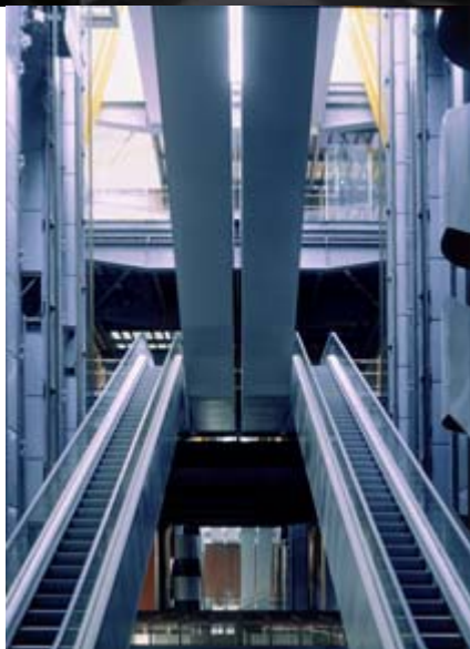
Escalera mecánica 2 Fotografía digital sobre papel Fuji profesional Digital photography on Fuji professional paper 173,00 x 125,00 cm