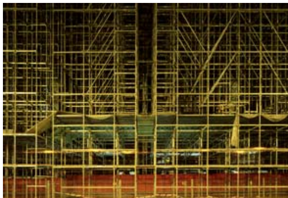
Estructuras 1 (2004) Estampa digital sobre papel Somerset Digital print on Somerset paper 125,00 x 190,00 cm