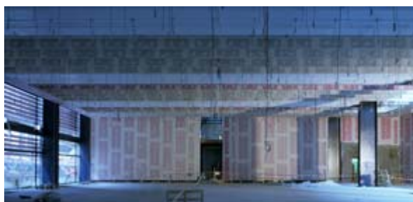
Nueva Sala RS-1 (2004) Fotografía sobre lienzo Photography printed on canvas 280,00 x 546,00 cm