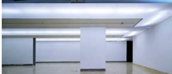
Galería Blanca (2004) Fotografía sobre papel Fuji profesional Photography on Fuji paper 125,00 x 295,00 cm