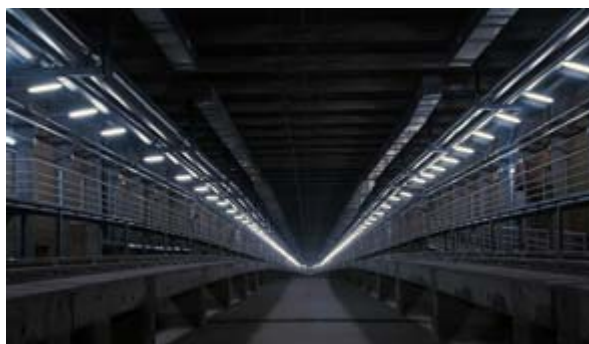
Túnel de luz (2004) Fotografía digital sobre papel Fuji profesional Digital photography on Fuji professional paper 125,00 212,00 cm