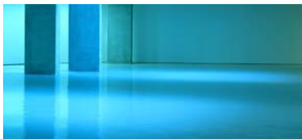
Espacio 9 (2003) Fotografía digital sobre papel Fuji profesional Digital photography on Fuji professional paper 123,10 x 273,40 cm