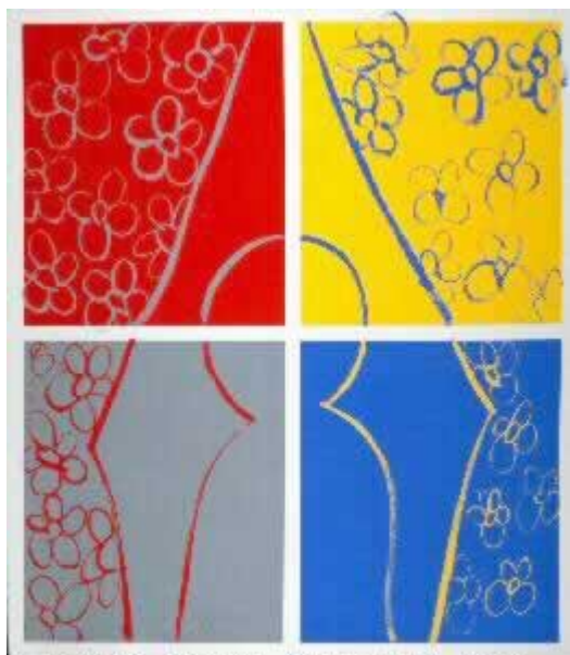
PELAYO ORTEGA. ÓVALO PARA SATIE