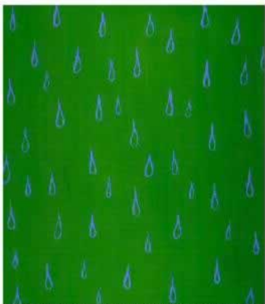
PELAYO ORTEGA. EL PAN NUESTRO DE CADA DÍA