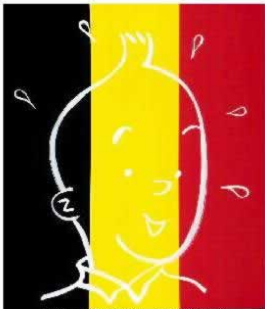
PELAYO ORTEGA. SIN TITULO