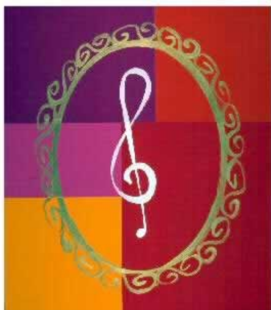
PELAYO ORTEGA. HOMENAJE A P. MONDRIAN