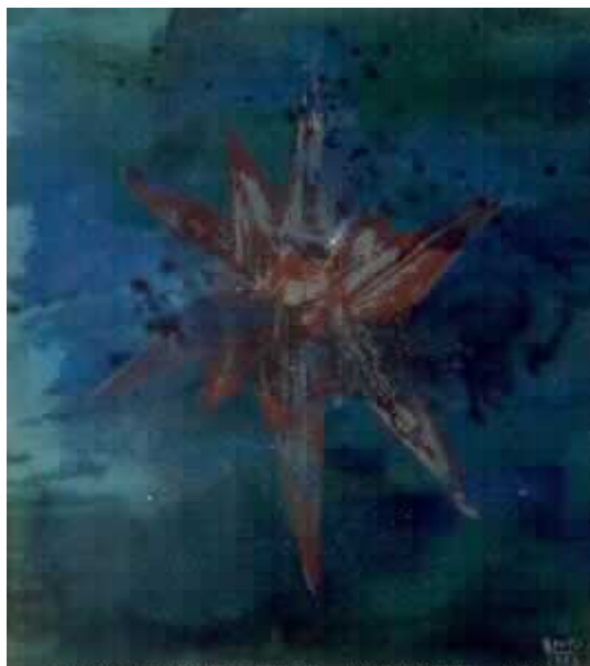
JOSÉ MANUEL BROTO. SIN TÍTULO, 1993