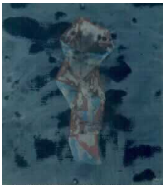
JOSÉ MANUEL BROTO. SIN TÍTULO, 1993