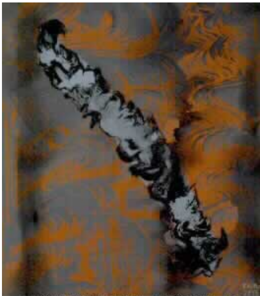
JOSÉ MANUEL BROTO. SIN TÍTULO, 1993