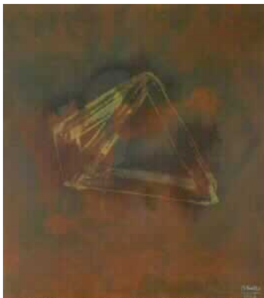
JOSÉ MANUEL BROTO. SIN TÍTULO, 1993