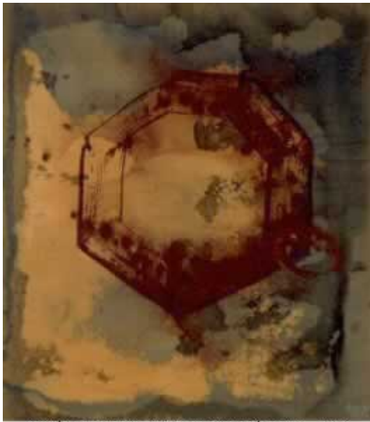
JOSÉ MANUEL BROTO. SIN TÍTULO, 1993