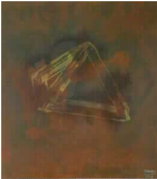
JOSÉ MANUEL BROTO. SIN TÍTULO, 1993