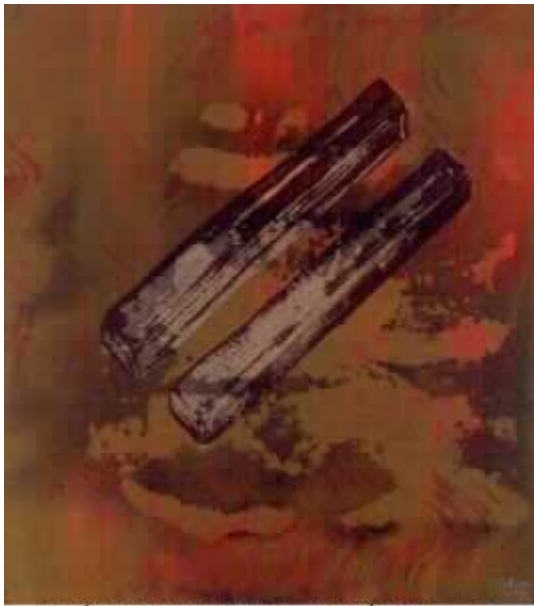
JOSE MANUEL BROTO. SIN TITULO, 1993