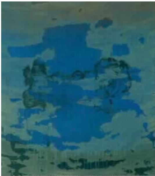
JOSE MANUEL BROTO. SIN TITULO, 1993