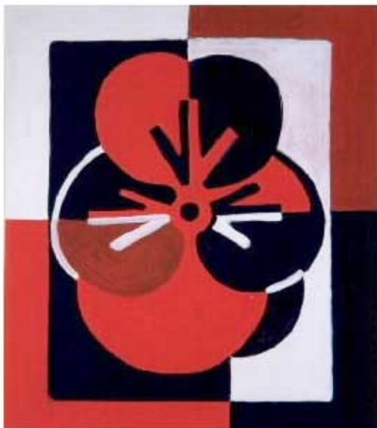
MANOLO QUEJIDO. SERIE TRES ELEVADO A TRES. SIN TÍTULO, 1992