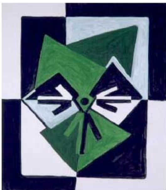
MANOLO QUEJIDO. SERIE TRES ELEVADO A TRES. SIN TÍTULO, 1992