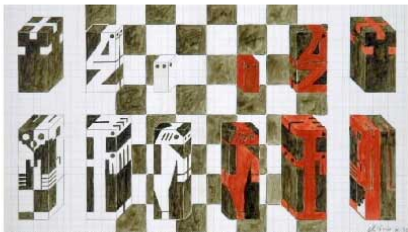
MANOLO QUEJIDO. SERIE TRES ELEVADO A TRES. SIN TÍTULO, 1992