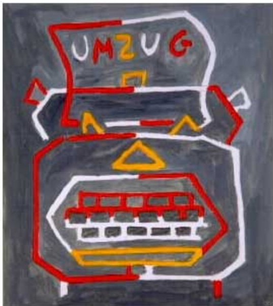
MANOLO QUEJIDO. SERIE TRES ELEVADO A TRES. SIN TÍTULO, 1992