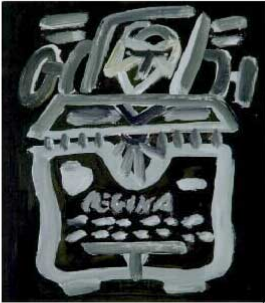
MANOLO QUEJIDO. SERIE TRES ELEVADO A TRES. SIN TÍTULO, 1992