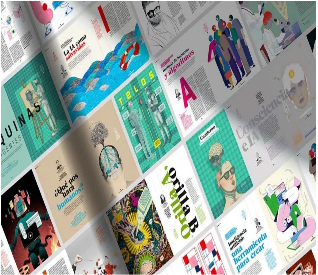
Collage de páginas de TELOS 123 – Inteligencia artificial