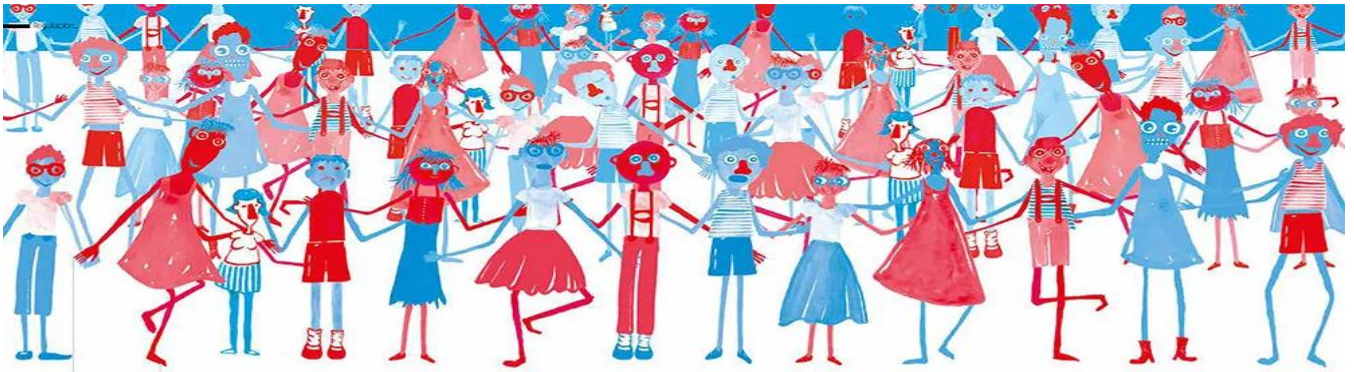
Palabras clave: brecha intergeneracional, pacto, posverdad, juventud, desafección, consenso