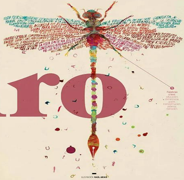
Palabras clave: educación, democracia, poder, transformación, posverdad, storytelling